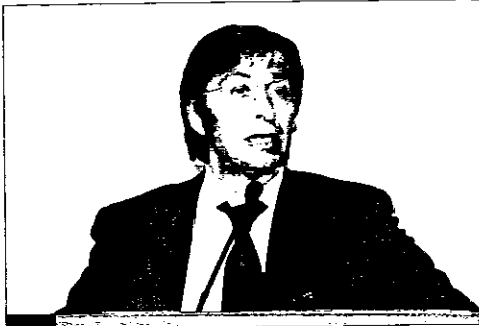
Vasco Errani, presidente della Regione Emilia Romagna