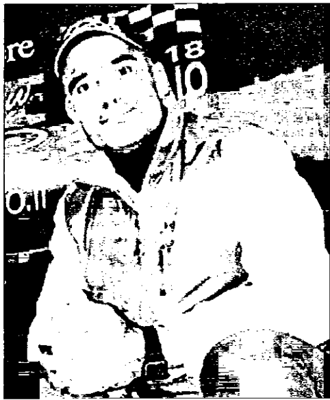
Fabrizio Meoni , lo sfortunato motociclista, morto alla Parigi-Dakar, aveva un rapporto speciale con Lugo

Assirelli non crede all'ipotesi del male... "Per carità, può capitare a chiunque, ma io penso che si sia trattato dell'incidente più banale che ti può capitare. Quando vedi cioè, davanti a te, un terreno piano, apparentemente senza ostacoli, cominci a fare qualcos'altro, mentre vai a velocità sostenuta. Cala la concentra-