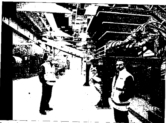
Il nuovo impianto di compostaggio inaugurato ieri mattina a Voltana

I tecnici di Hera hanno quindi illustrato le varie sezioni dell'impianto di compostaggio. Si parte dalla ricezione e stoccaggio del legno, dove i rifiuti vengono immagazzinati e triturati; quindi c'è la sezione di ricezione dei rifiu-