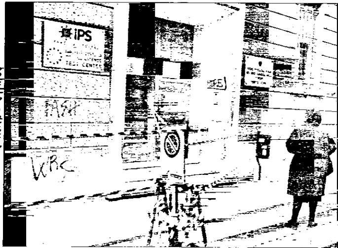
Diverse persone hanno osservato incuriositi le transenne davanti allo Stoppa

media, e i corsi di alfabetizzazione e perfezionamento dell'italiano per stranieri, con una presenza, ogni sera, di almeno 40 persone. Ora si attende il responso dei tecnici, che ieri, spiega l'assessore provinciale all'edilizia scolastica Germano Savorani, «hanno raggiunto il tetto dell'edificio, per verificare la causa del problema. Potrebbe infatti essersi trattato di un fatto isolato, oppure potrebbe esserci un deterioramento della struttura interna del tetto, che, trattandosi di un edificio antico, è tutta in legno, che potrebbe essere