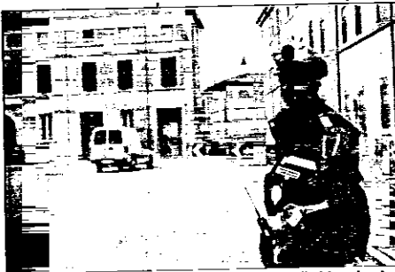
A giorni partiranno alcune variazioni che riguardano le tariffe dei parcheggi

LUGO - Entro pochi giorni entreranno in vigore variazioni alle tariffe delle soste in alcune aree del centro storico di Lugo e nel parcheggio di Largo Gramigna, sul retro dell'ospedale. Quest'ultimo parcheggio, che ha una disponibilità di circa 400 posti auto, vedrà l'incremento della libera sosta che passerà dagli attuali 34 stalli gratuiti al cospicuo numero di cento. Era una promessa che il sindaco di Lugo Raffaele Cortesi aveva fatto nel corso della sua campagna elettorale nel giugno scorso, promessa che ha mantenuto. Negli altri trecento posti si continuerà a pagare ma il cittadino dovrà "sborsare" solamente 50 centesimi per l'intera giornata, anziché cinquanta centesimi per la prima ora più dieci centesimi per ogni ora successiva. Invariato invece l'orario della sosta a pagamento, dalle