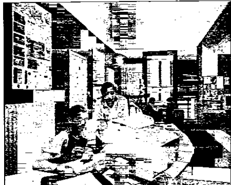
Il centro giovani da oggi riapre i battenti per la nuova stagione

LUGO - Oggi il Centro giovani Padre Leo Commissari di Lugo è in festa: alla presenza del Sindaco Raffaele Cortesi e degli assessori del Comune di Lugo avrà luogo, alle ore 15.30, l'inaugurazione della stagione 2004-2005. Nel corso del pomeriggio verranno presentati i vari laboratori attivati ed ogni spazio vivrà attraverso esibizioni live di musica e danza; potrà essere ammirata una mostra fotografica e si potrà visitare il centro, un'occasione importante per toccare con mano quanto si è realizzato fino ad oggi e per chiedere eventuali spiegazioni su di un luogo dove i giovani possono trascorrere il proprio tempo.