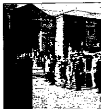
Un momento della manifestazione in piazza Baracca