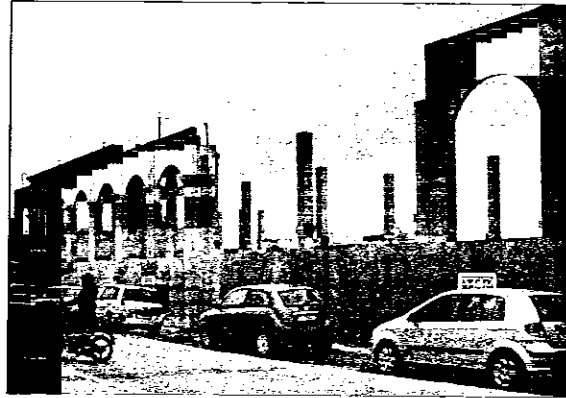
La via Foro Boario all'inizio dei lavori di ampliamento del Globo