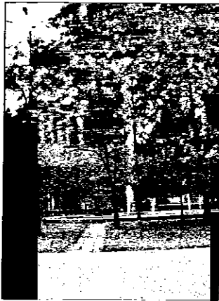
L'ingresso del parco del Tondo