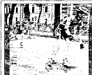
Con 'Sportinsieme' tornano nel pomeriggio le corse sui pattini in piazza Trisi

Terza giornata oggi delle iniziative organizzate per la sesta edizione di "Sportinsieme". Alle 15, nella pista coperta di pattinaggio di via Piratello, trofeo "Sportinsieme" di pattinaggio artistico valido quale secondo Memorial Mario Toni, e alla stessa ora torneo di calcio aziendale. Alle 16 si rinnova l'appuntamento con le corse di pattinaggio in piazza Trisi (nel-