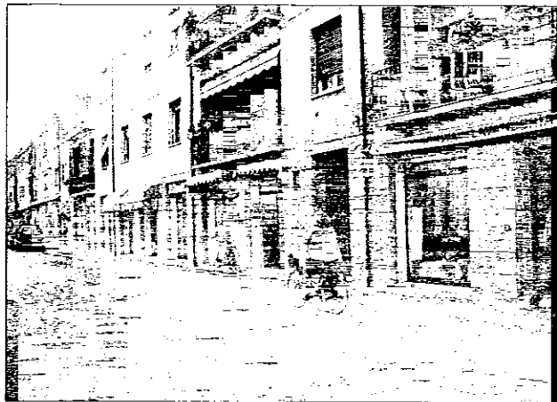
Via Ricci Curbastro, una delle strade in cui saranno realizzati nuovi marciapiedi

Con un investimento di oltre tre milioni e mezzo di euro l'amministrazione comunale sta provvedendo a rifare le strade e i marciapiedi di Lugo. Alcuni interventi sono già stati realizzati, altri sono in corso ed altri ancora sono stati programmati per i prossimi mesi. A un milione e 26 mila euro ammonta la cifra destinata a un primo intervento che prevede il completo rifacimento di 15 strade del centro città, dei quartieri e delle frazioni. Nell'ambito di questo intervento sono già state rifatte la via Ruina e la pista ciclabile di viale Dante, quindi si passerà alla ciclabile di viale Masi, dove saranno realizzate anche diverse aiuole. Le altre strade che a Lugo saranno interessate dai lavori sono le vie Lumagni, Macello vecchio, dei Mille, Da Vinci, e i vicoli Vespignani, Rainieri e Pezoli. Per quanto riguarda le frazioni, saranno rifatte le vie della Pace e 6 Marzo a San Bernardino, la via Fraielli Fabbri a Villa San Martino, la via del Parco a Bizzuno e la via Indipendenza a Voltana. E' inoltre in corso la gara d'appalto per risistemare altre 17 strade del centro stori-