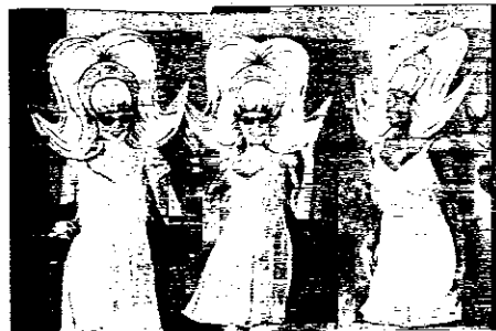
Il Rossini apre le sue porte a un importante evento di moda

tibile dal punto di vista qualitativo, all'interno del Teatro Rossini, uno dei simboli di Lugo, non è che un rimarcare l'importanza della serata e di un principio fondamentale che la città porta avanti da sempre: da qui la scelta dell'amministrazione di sostenerla e di inserirla, a pieno titolo, nel programma delle attività targate "Lugo Città Mercato", un marchio oramai conosciuto e indiscusso che, oltre alla promo-