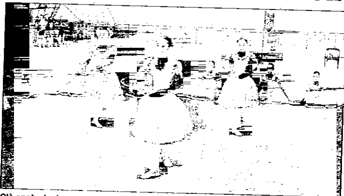
C'è anche la danza tra le esibizioni di 'Sportinsieme' previste fino a lunedì

Inizia stasera, alla pista coperta di pattinaggio in via Piratello, la sesta edizione di 'Sportinsieme', iniziativa che prevede esibizione e gare sportive, nonché momenti di spettacolo e di solidarietà. Il via sarà dato, alle 18 dal torneo di pallavolo femminile, a cui seguirà, alle 19, l'apertura dello stand gastronomico e una cena il cui ricavato andrà a favore dei bambini di Chernobyl. Quindi alle 20 esibizione di ginnastica artistica, le semifinali di volley femminile e, allo stadio di Lugo, torneo di calcio a 5. Domani sera previste esibizioni di danza, di yoga e uno spettacolo dei 'Diavoli della frusta'.