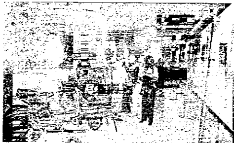
Due immagini che testimoniano l'evoluzione della bicicletta: dalle due ruote per il lavoro alla tecnologia utilizzata dal corridore Marco Pantani