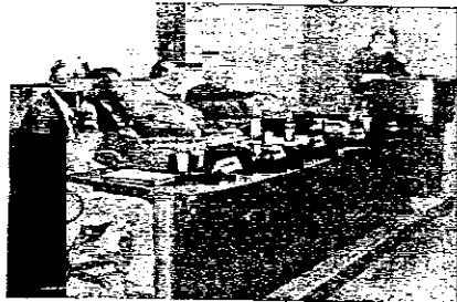
Un momento del dibattito sul tema "La bicicletta in Romagna tra storia e cultura"

"La bicicletta in Romagna tra storia e cultura" è stato detto - che è servita anche per far viaggiare la cultura, il femminismo, la Resistenza, oggi il turismo e la vita all'aria aperta. Senza dimenticare il significato che la stessa "due ruote" ha spesso nella letteratura romagnola.