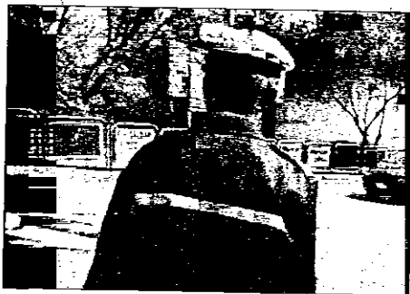
Tutti i vigili urbani in forza a Lugo saranno impegnati nelle strade cittadine in occasione del Giro di Romagna di ciclismo e del torneo internazionale di volley femminile, nella giornata del 4 e 5 settembre. Diversi i cambiamenti previsti alla viabilità cittadina in concomitanza con gli eventi sportivi

Dè Brozzi (tratto compreso tra le vie Fiumazzo e Foro Boario), Fiumazzo, Keplero, Piratello e Piazza Garibaldi. Verranno inoltre posizionate delle pre chiusure in via Quarantola in via Provinciale Macallo a S.Potito, in via Piratello, lato Bologna, all'altezza della rotonda Somec e, infine, in via Piratello, lato Ravenna, all'altezza della piscina comunale. "Tutti i vigili urbani sono mobilitati per il 5 settembre - precisa il comandante della Po-