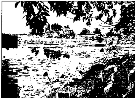
Il Parco del Loto che è situato a ridosso del Canale dei Mulini

La pista ciclabile del Canale dei Mulini è fra i pensieri della nuova amministrazione. Anche se, al momento, mancano il progetto e le forze economiche, l'assessore all'ambiente del comune di Lugo, è certo di una cosa: la pista ciclabile del Canale dei Mulini vedrà finalmente la luce. Già da anni si parla, infatti, della valorizzazione dell'itinerario, particolarmente apprezzato per i significati storico-naturalistici che esprime. Dopo un primo approccio che sembrava