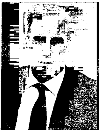
Vidmer Mercatali, sindaco di Ravenna

di Ravenna come ogni anno passerà qualche giorno delle sue vacanze (poche) alle terme di Bagno di Romagna, per il resto andrà al mare, come sempre, a Lido di Dante. Quanto alle letture, ammette il sindaco, "mi porterò dietro "La vita è un pallone rotondo" di Vladimir Dimitrievic. Mentre il primo argomento che tratterò al mio rientro sarà affrontare le strategie per combattere l'aumento delle polveri sottili (PM 10) causate dall'inquinamento.