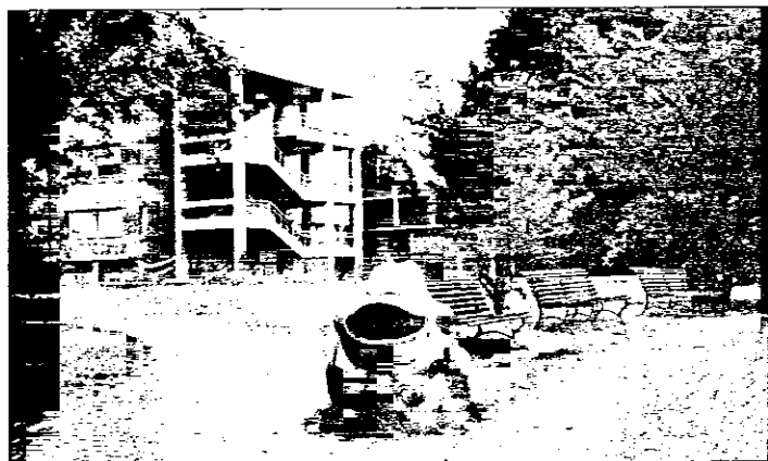
Il Tondo di Lugo: a sinistra, sullo sfondo, il liceo scientifico con i lavori in corso (foto idea)

Mossa a sorpresa degli ambientalisti, il parco respira