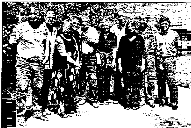
Il gruppo dei sindaci del Lughese riuniti durante la prima seduta dell'Associazione