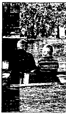
Suggerimenti anti-caldo agli anziani

Per il 2004, il Comune di Lugo ha ritenuto opportuno avviare due interventi,