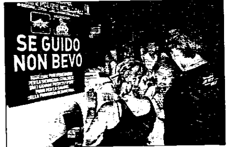
L'iniziativa ha già toccato diversi locali notturni del Lughese

L'iniziativa, partita il 17 giugno, ha già toccato 10 locali del divertimento giovanile tra Marina di Ravenna Cervia, Lugo e Lido di Savio. All'interno dei locali vengono allestiti spazi riservati di grande visibilità, messi a disposizione dai gestori, nei quali lo staff Exstasy dell'Ausl, con la collaborazione delle polizie municipali, accolgono i giovani che intendono sottoporsi alla prova dell'etilometro, forniscono informazioni e somministrano loro un questionario sulla guida sicura e il consumo di alcool; ai ragazzi che partecipano viene inoltre regala-