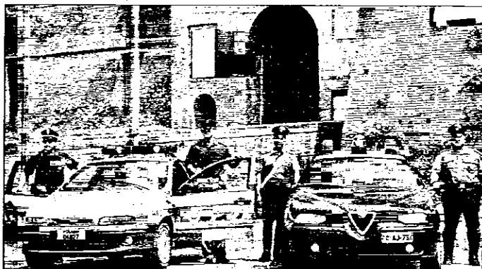
Polizia di Stato e Carabinieri impegnati in servizi di controllo

LUGO - “Attenti alla sicurezza, ma con serenità”. E' questo il messaggio che arriva da Lugo e che pare stia dando buoni frutti. Nella città di Francesco Baracca, infatti, è nata una importante collaborazione, che vede impegnati fianco a fianco, Polizia di Stato, Carabinieri, Guardia di finanza e Polizia municipale. Ma non solo. Grazie alla disponibilità di commercianti e cittadini, in pratica la città è monitorata 24 ore su 24 e, soprattutto, in ogni sua parte. E, proprio per cercare di prevenire fenomeni malviventi e di ordine pubblico, sono stati predisposti una serie di controlli del territorio, coordinati fra le varie forze di polizia. L'iniziativa, è partita da alcuni messaggi specifici, arrivati da sedi istituzionali, ma anche da singoli cittadini. Sensibili al problema e, soprattutto, per non creare inutili allarmismi da “caccia alle streghe”, Polizia di Stato, Carabinieri, Guardia di finanza e Polizia municipale, hanno preso accordi per mettere in campo tutta una serie di controlli in maniera coordinata. La decisione è stata quella di effettuarli “in maniera visibile” per contrastare e