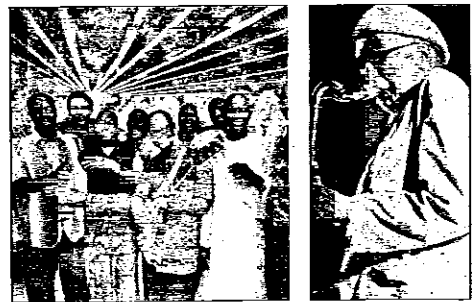
I Baobab e Charles Lloyd

L'estate musicale lughese quest'anno si presenta con un 'look' del tutto rinnovato, a partire dal nome: "Lugo Musica Estate" è infatti il titolo della rassegna finora nota come "Pavaglione Estate", che giunge così alla XXII edizione. Un'altra novità riguarda poi la sede degli spettacoli, che non si svolgeranno più in diversi scenari ma avranno tutti luogo nel Chiostro della Banca di Romagna. Non cambia invece l'impostazione artistica della rassegna, che anche quest'anno sarà dedicata al jazz, con 6 appuntamenti che avranno per protagonisti grandi interpreti e compositori americani, sudamericani, senegalesi, olandesi, italiani e francesi, con proposte musicali disperate, unite dal comune denominatore dell'improvvisazione: in questa rassegna, il jazz sarà infatti interpretato nelle sue più svariate forme, dal 'latin' all'afrocubano, all'avanguardia siculo-europea al 'free', fino a tutte le possibili commissioni con le più diverse