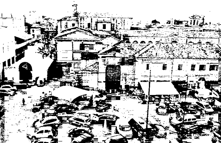
L'Expo in un'immagine d'archivio

Tutto è ancora in embrione ma alcune previsioni si possono già azzardare, senza correre grandi rischi di essere smentiti dai fatti. Il numero degli stand dovrebbe variare dai 350 ai 400 e la superficie totale interessata sarà di circa 11.000 metri quadri. Aperte anche le iscrizioni. Per prenotare il proprio spazio ci si può recare direttamente al civico 41 di Via Mazzini oppure telefonare allo 0545 26491 (fax 0545 27036). E tutto pare partire senza ombra di polemiche: lo stesso Ustignani ha detto a più riprese che "ogni idea delle Associazioni di categoria sarà bene accettata e tenuta nella massima considerazione".