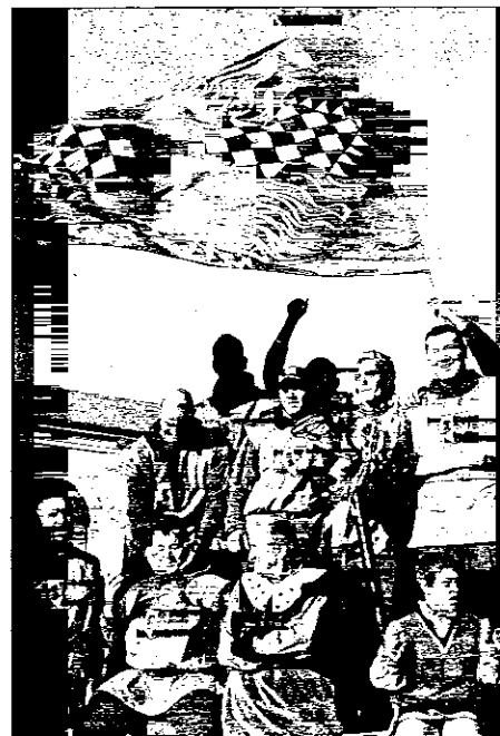
Sore, festa grande per i rionali di Madonna delle Stuoie, dominatori del Palio della Caveja per la sesta volta consecutiva. A sinistra un momento della gara fra i quattro rioni

tutte le sfide (bandiere, musicisti e Caveja) è andata al Rione Brozzi, vero dominatore della manifestazione nel suo complesso, grazie alle performance nelle gare delle bandiere e dei musicisti, e che ha potuto portare a casa il drappo realizzato dall'artista lughese Nerio Liverani.