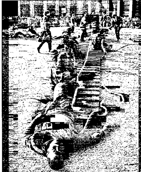
Gli atleti delle Stuoie distrutti dopo una tirata vincente