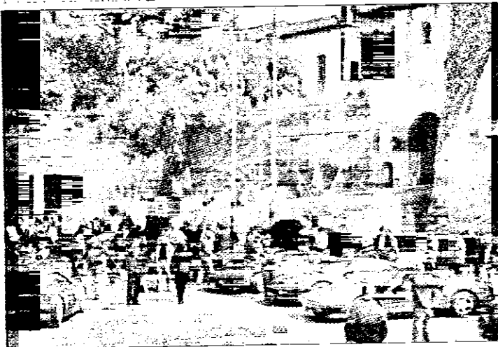
Ferrari ai piedi della Rocca durante la 'Festa del cavallino rampante' del 2003

regolarità che si svolgerà all'aeroporto di Villa S. Martino, dalle 15 alle 18. Quasi contemporaneamente (dalle 17.30 alle 18.30), le vetture partecipanti al raduno saranno esposte a Bagnara di Romagna, accanto alla Rocca e in viale Matteotti. La domenica, ai partecipanti al raduno si aggiungeranno anche i rappresentanti dei Ferrari Club (lo scorso anno furono ben 42) per partecipare all'iniziativa dal titolo: 'L'epopea del Cavallino Rampante' che si svolgerà al Rossini (alle 10). Ospiti dell'iniziativa. Irene Guerri e Marco Pluviano, autori del libro 'Francesco Baracca una vita al volo', e il capitano Michele Medici, in rappresentanza del 9° Stormo caccia 'Francesco Baracca' di base a Grazzanise (Ce). Nel pomeriggio, i partecipanti alla Festa assisteranno al corteo storico ed al Palio del