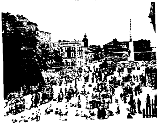
"La città dei bambini" in un'immagine dello scorso anno

A culmine della settimana estense, venerdì 14 si svolgerà l'Infiolata, a cura degli alunni delle scuole elementari, dalle 14.30 alle 16.30 con premiazione, quindi prenderà il via il corteo con il busto del patrono sant'Illaro, delle autorità e dei noni con partenza da piazza Martiri alle ore 17.30 che si concluderà nella chiesa del Carmine per la santa messa, in tempo per il "Concerto di musica medievale" del coro Sistro di Bologna. Più prettamente nevocativa la serata di sabato con gli "Onori al duca Borso d'Este" e l'elezione della "Soave creatura" nell'antico piazzale della Fiera alle 21. Domenica 16, nel centro storico avrà luogo il XXXV Palio della Caveja: dalle ore 15 con i cortei dei noni e alle 17 con il palio vero e proprio.