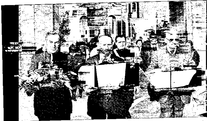
L'entrata principale del cimitero lughese durante una cerimonia di qualche mese fa

Crescita in vista per il cimitero di Lugo, la cui capienza sarà presto incrementata con due interventi, di cui uno molto cospicuo. La parte più antica, tuttora esistente (fa parte del patrimonio artistico della città), è di impianto neoclassico, con emiciclo e loggiato al piano rialzato, realizzata nel 1877 nell'area dove esisteva già un primo cimitero costruito nel 1805. Successivamente è stato più volte ampliato nella parte retrostante e, negli anni Ottanta, a ridosso del muro di cinta accanto al canale Tratturo, che costeggia la 'S. Vitale'. In quest'ultima area è attualmente in corso un intervento di ampliamento per la realizzazione di 246 nuovi loculi. Inoltre, il Comune ha previsto la realizzazione di una nuova struttura cimiteriale che sarà costruita nelle immediate vicinanze, nell'area oltre il canale Tratturo, verso S. Agata. Si tratta di un'opera molto rilevante e complessa, per la