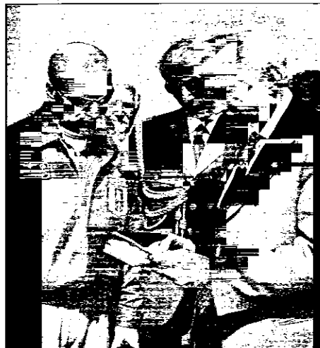
A destra il sottosegretario alla Difesa, Filippo Berselli

Berselli ha deciso di sfilare la sciacola dal foderò, intanto la realtà conferma le preoccupazioni che da molti an-