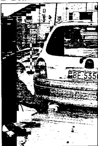
Il controllo del gas di scarico

Sono dodici le officine, situate nel territorio lugheese, autorizzate al rilascio agli automobilisti del bollino blu che certifica il rispetto dei limiti delle emissioni inquinanti dei veicoli. L'attestazione del bollino blu è valida in tutto il territorio nazionale e l'Ufficio relazioni con il pubblico del Comune invita i cittadini ad applicare sui propri veicoli l'apposito adesivo. Le officine attualmente autorizzate al rilascio del bollino sono: Romualdi e Venturini (via Jacchia 13), Sarvi (via Bonsi 4), Fratelli Zani (via Bonsi 6), Fratelli Sarvi (via Bonsi 14), Ravaglia Angelo (via De Brozzi 94/5), Marzani e Co (via Circondario sud 44), Morini centro revisioni (via Piratello 20), Auto Europa srl (via Piratello 108/3), Centro diesel (via Fermi 46), Autofficina Biondini (via Copernico 23), Autofficina Casadio Giovanni (via Fornace Vecchia 8, Villa San Martino), Astra snc (via Rotaccio 60, Voltana). Per informazioni è possibile rivolgersi al Servizio commercio e attività produttive (telefono 0545-38378) oppure all'Ufficio relazioni con il pubblico (telefono 0545-38444 o 0545-38559).