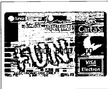
Sono interessati i giovani tra i 14 e i 25 anni dei comuni della Bassa Romagna