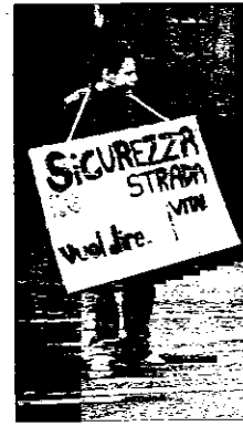
Alcuni studenti con i cartelli nelle strade di Lugo.