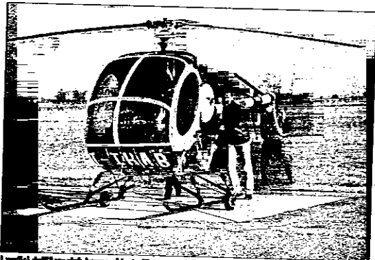
I vertici dell'Aeroclub hanno chiesto l'appoggio della Regione per l'acquisto di elicotteri