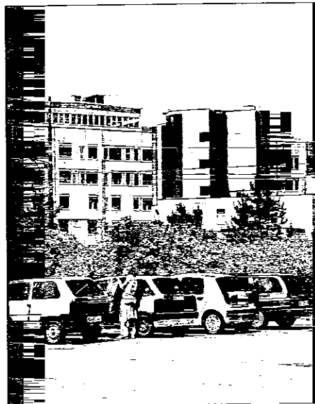
Il nuovo parcheggio dell'ospedale «dovrà essere libe-

definiscono le 'famigerate' righe azzurre, ovvero le aree a pagamento, effettivamente troppe, evitando anche il gratta-e-parcheggia. Credo sia un provvedimento utile e per i lughesi e per chi arriva da fuori. Non è tanto una critica all'esistente, quanto un modo per migliorarlo. Puntò anche alla liberalizzazione del grande parcheggio dell'ospedale. Chi vi si reca non deve pagare per visitare un proprio familiare ricoverato». Ma Cortesi non si limita alle soste. «Le strade devono essere il più possibile sicure — prosegue — per cui, dove occorre, si dovrà intervenire sul manto, proprio per garantire una buona viabilità; meno buche ci sono sull'asfalto, meglio è. Altri punti importanti: il mantenimento dei servizi e un occhio di riguardo per l'ospedale di qualità; penso alle liste d'attesa che vanno ridotte ai minimi termini e ai servizi per anziani e bambini. Il patrimonio pubblico è importante, va costan-