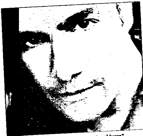
Safina, protagonista di “La bella dormiente nel bosco”

LUGO. Si è aperta il 19 marzo al Teatro Rossini la rassegna “Lugo Opera Festival” con “La scala di seta” di Gioachino Rossini. Mercoledì 14 aprile il sipario si apre invece sul grande “Concerto Lirico” con gli interpreti delle opere “El retablo de Maese Pedro” con musiche di Manuel de Falla, e “La bella dormiente nel bosco”, musiche di Ottorino Respighi, che sono in cartellone il 20, 22 e 24 aprile. “La bella dormiente nel bosco”, originariamente era stata prodotta per le marionette del Teatro dei Piccoli Vittorio Podrecca, mentre “El retablo de Maese Pedro” era stata commissionata dalla Principessa di Polignac per il teatrino delle marionette del suo palazzo. Per entrambi i lavori l'organico orchestrale era ridotto. Oggi sul palcoscenico al posto delle marionette c'è un cast di affermati cantanti affiancati da orchestra e coro del Comunale di Bologna. “Lugo Opera Festival” propone poi due concerti d'organo. Il primo il 18 aprile (ore 11) con l'olandese Liuwie Tamminga all'organo Callido