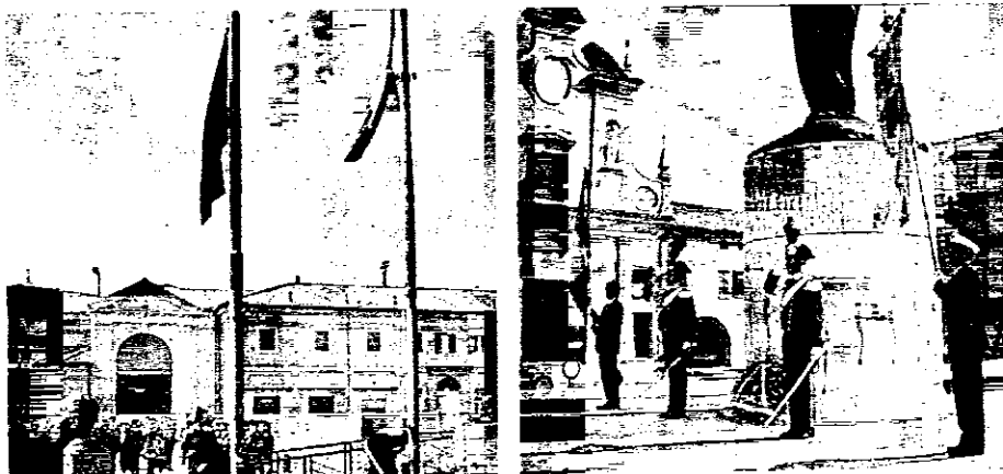
A celebrare la bandiera italiana si è riuniti ieri mattina gran parte della città, in una manifestazione in piazza Baracca. L'alzabandiera era organizzata dal Lions Club.

In piazza Baracca alzabandiera, picchetto d'onore e una corona ai caduti Convegno, relazioni e testimonianze al teatro Rossini