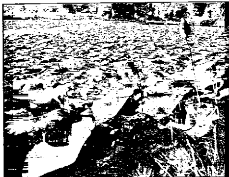
Il Parco del Loto

Il Comune quindi passa la mano per i prossimi tre anni, dal 2004 al 2006 con una pre-