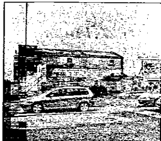
La zona dell'ex oleificio

Approvato dal consiglio comunale il 12 settembre scorso, l'intervento interessa una superficie di 8.370 metri quadri, caratterizzata da capannoni industriali ora in parte abbattuti e al cui posto sorgeranno nuovi fabbricati: 3 edifici ad uso residenziale per un totale di 20 alloggi sono attualmente in via di costruzione in un lotto interno all'area, 2 nuovi stabili sorgeranno a lato di via Piratello e all'angolo con via Mentana, più un edificio ad uso commerciale sempre su via Piratello. Il progetto prevede inoltre la realiz-