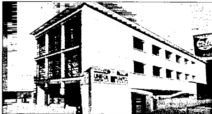
La cerimonia di inaugurazione è prevista per oggi, alle ore 10. Saranno ospiti anche gli sportelli di Unipol Assicurazioni e di Unipol Banca

Questa costruzione è in grado di offrire al suo interno non solo l'erogazione di servizi tanto classici quanto innovativi per l'avvio e la conduzione dell'impresa, ma anche strutture adeguate alla formazione professionale e manageriale ed al re-