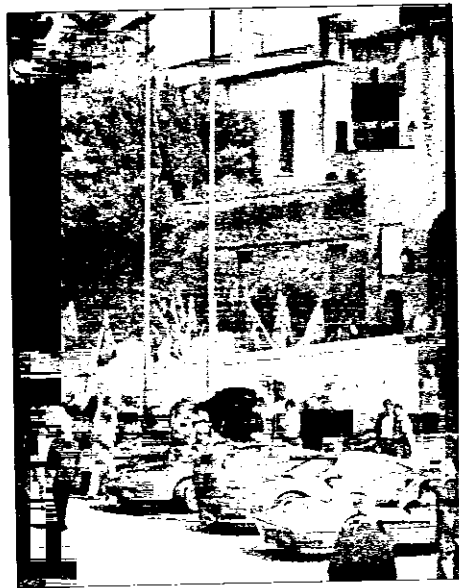
Il 15 e 16 maggio le Ferrari torneranno in piazza

Altra manifestazione molto attesa è la quinta edizione della Festa del Cavallino Rampante che richiamerà a Lugo, in occasione del meeting internazionale dei Ferrari club, decine di stupende vetture rosse di Maranell-