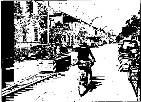
La fioriera nel mezzo di via Amendola è stata tolta pochi giorni fa