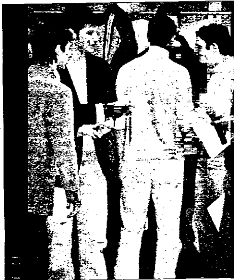
Gli studenti vogliono farsi coinvolgere sui temi più importanti