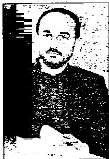
Il sindaco di Lugo Maurizio Roi

Con il bilancio 2004 - ha proseguito Roi - si chiude la legislatura per, questo ci tengo a sottolineare la filosofia di fondo, il senso profondo della nostra azione amministrativa. Ogni scelta compiuta è stata orientata a perseguire tre scopi. Prima di tutto modernizzare Lugo, sotto il profilo economico, culturale, sociale,