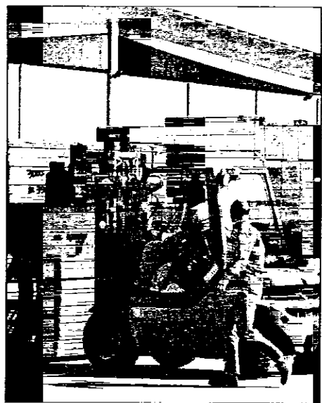
La società 'Lugo Terminal' ha previsto investimenti per 4 milioni di euro al Centro merci