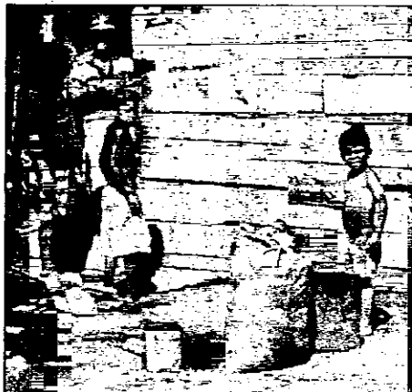
La somma raccolta è destinata alle favelas di Sao Bernardo