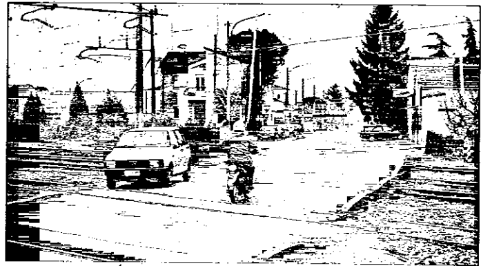
Il passaggio a livello situato in via Rivali San Bartolomeo

Stato, rispettivamente con un investimento di 2 milioni e 1 milione e 550mila euro: il progetto prevede la realizzazione di un sottopasso carrabile e ciclopedonale che collegherà via Felisio a viale Oriani, sfociando all'altezza della nuova stazione delle corriere, di fronte a cui verrà realizzata una rotonda. Verranno così eliminati i passaggi a livello sulla via Felisio e resa pienamente fruibile la stazione delle corriere, attualmente adibita solo a parcheggio. «In contemporanea a questo intervento, che si concluderà entro il 2005 e per il quale abbiamo già avviato gli espropri — prosegue il vicesindaco — il Comune, con un investimento già stanziato di 2 milioni di euro, realizzerà alcune opere finalizzate a consentire l'accesso al quartiere Lugo Ovest, che altrimenti rimarrebbe isolato in direzione Faenza. Il progetto, che verrà concordato con il consiglio di circoscrizione, consisterà o in un ampliamento di via