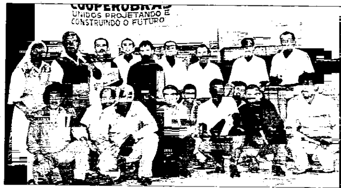
I componenti della cooperativa di muratori 'Cooperobras' nata a Sao Bernardo