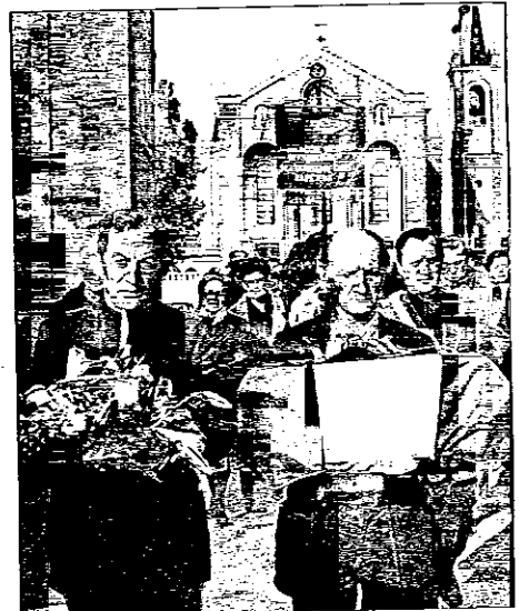
L'ingresso del cimitero di Lugo in occasione del rientro della salma di un soldato morto in Russia

un ettaro per un importo di quasi un milione e 300 mila euro». I lavori avranno inizio nella primavera del 2004 e nella nuova area del cimitero sarà possibile non solo realizzare altri loculi, ma vista la richiesta anche il tal senso, di realizzare tombe di famiglia. Ma nel voluminoso piano dei lavori previsti dal Comune ci sono altri interventi riguardanti i cimiteri delle frazioni. E se a S. Poito l'ampliamento del cimitero è già stato realizzato, a Voltana è in programma la costruzione di un "campo comune" nel cimitero: i lavori, che avranno un costo di 155 mila euro, dovrebbero concludersi entro il primo semestre 2004.