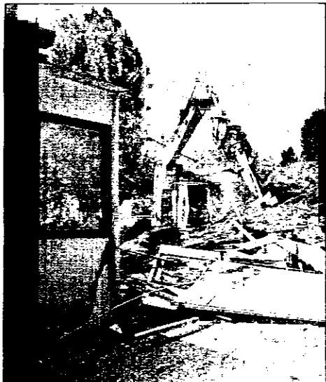
La demolizione della vecchia scuola media di Voltana

Voltana, la frazione di Lugo con il maggior numero di abitanti (circa tremila), entro un paio d'anni avrà un polo scolastico completamente rinnovato. Da alcune settimane, infatti, hanno preso il via i lavori che porteranno alla realizzazione di una struttura in grado di ospitare scuola materna, elementare e media in un unico edificio, una nuova palestra e un'ampia area verde pubblica formata dal già esistente parco "Saturno Montanari" e dal residuo della scuola media, demolita alcune settimane fa. E la posa della prima pietra della scuola è in programma sabato 18 ottobre, alle 10.30. L'elaborazione dei progetti del polo scolastico non è stata priva di ostacoli. Infatti, la bozza illustrata un anno e mezzo fa ha dovuto subire non poche modifiche a causa del non completo consenso da parte della cittadinanza. Dopo mesi di riunioni e verifiche i lavori sono ora fi-