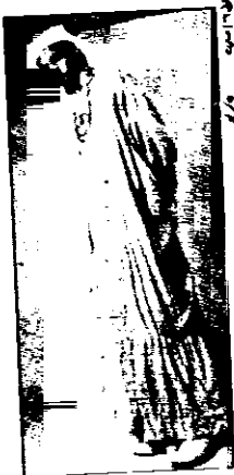
Il pianista Omar Sosa

Comincia a Lugo, all'interno della rassegna 'Pavaglione Estate', il tour europeo dell'Omar Sosa quintet. Domani sera, alle 21.15, nel Chiostro del Monte, concerto del pianista cubano che, dopo i successi raccolti negli Stati Uniti e in Francia, sta ora conquistando anche la scena italiana. È di quest'anno il suo nono album Ayayuna , che segue Sentir , pubblicato nel 2002 ed eletto miglior album di Afro-Caribbean jazz dalla Jazz Journalists Association di New York. Nei suoi brani, ritmi e melodie dei Caraibi e del Marocco, contaminati da rap e jazz contemporaneo.