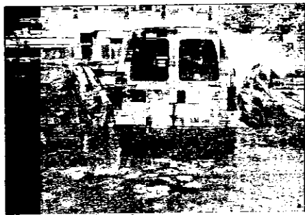
Nel parcheggio dell'ospedale una zona di sosta a pagamento, disponibile per chi si reca a trovare la persona ricoverata.

avranno un'area riservata, come nella precedente convenzione, ma potranno parcheggiare dove troveranno posto, in tutta l'area a pagamento. Confermati anche gli attuali quindici posti a disco orario di un'ora, per agevolare i cittadini che devono recarsi al Comando di Polizia Municipale. Restano in vigore le "categorie esenti", già previste nella precedente convenzione. Malati oncologici, utenti del day-hospital, persone che necessitano di terapia riabilitativa e dializzati potranno parcheggiare gratui-