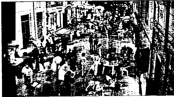
Anche quest'anno i mercoledì sera si animano le vie del centro

Il programma di oggi propone, oltre all'apertura serale degli esercizi del centro, "I mercanti nel mercato": mercatino di antiquariato e hobbistica (dalle 18 nel Pavaglione), un laboratorio di manipolazione di argilla (in piazza Mazzini dalle 19), un raduno di auto e moto d'epoca a cura del Motoclub F. Baracca, sezione