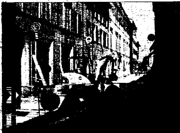
Un'immagine dei cantieri aperti per la ristrutturazione di via Matteotti