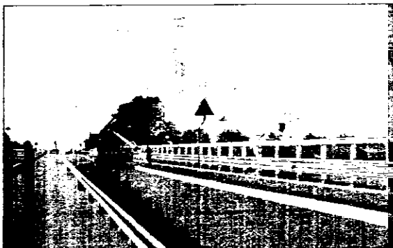
L'intervento del ponte di Sant'Agata è diretto otto mesi

catissima San Vitale. La protesta più vistosa era comunque venuta dal Supermercato 'Billa', che aveva presentato ricorso al Tar per via dell'inevitabile danno economico conseguente al fatto che la struttura commerciale veniva 'tagliata fuori' per vari mesi dall'abituale flusso di traffico. Anche l'intervento di ricostruzione del ponte era comunque inevitabile: la vecchia struttura si presentava alquanto fatiscente ed inoltre l'Autorità di Bacino ne aveva imposto la ricostruzione per mettere in sicurezza la zona da alluvioni e allagamenti. I lavori si sono conclusi puntualmente sulla tabella di marcia: i giorni di ritardo, dovuti alle piogge primaverili, si contano sulle dita di una mano, dal momento che l'obiettivo era concludere il tutto