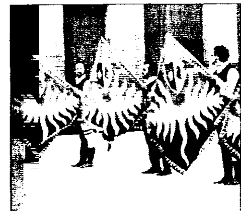
Gli sbandieratori saranno di scena oggi al Pavaglione

Dopo il giuramento dei rioni svoltosi ieri, quest'oggi entrano nel vivo le manifestazioni della Contesa estense. Alle 21, nel piazzale del Pavaglione, è infatti in programma la XXVI edizione del Palio degli sbandieratori. Questa sera sono previste le gare riguardanti le specialità del singolo, della coppia e della piccola squadra, mentre la competizione riguardante la grande squadra è in programma domani sera, sempre al Pavaglione, in occasione del Palio dei musici. Le premiazioni sono previste alle 22.45 e anche stasera nel piazzale del Pavaglione è aperta l'Antica hostaria di Spasione. Da segnalare inoltre che domani mattina, a partire dalle 10, in piazza Martiri è previsto il raduno delle Ferrari che partecipano alla quarta Festa dedicata al Cavallino rampante.