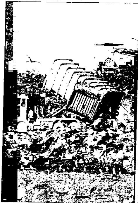
La discarica di Hera in via Romea Nord