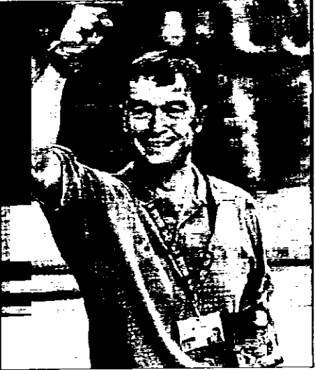
Grandi sportivi incontrano i giovani lughesi: Bonitta, qui sopra, e Sefi Idem, accanto al titolo, illustrano i ragazzi della scuola per insegnarli alla pratica sportiva, iniziativa dell'assessore Strocchi

Commissario Tecnico della Nazionale Italiana Femminile di Pallavolo, Campione del Mondo nella scorsa estate e battezzata prepotentemente agli onori della cronaca come un autentico fenomeno di costume capace di attirare su di sé le attenzioni di un'intera nazione. Bonitta parlerà coi i ragazzi e racconterà le proprie esperienze, rispondendo poi alle domande che gli verranno rivolte. "L'attività sportiva - sottolinea l'assessore Andrea Strocchi - è uno strumento di crescita della persona ed in particolare dei giovani, un'occasione di confronto e coesione. Lo sport, oltre a dare benefici al fisico, favorisce anche l'integrazione e la socializzazione. Lo sport, se correttamente insegnato, può essere un veicolo di partecipazione alla vita sociale, di tutti e per tutti, senza alcuna discriminazione. E' in tale prospettiva che intende muoversi l'Amministrazione comunale, favorendo le oc-