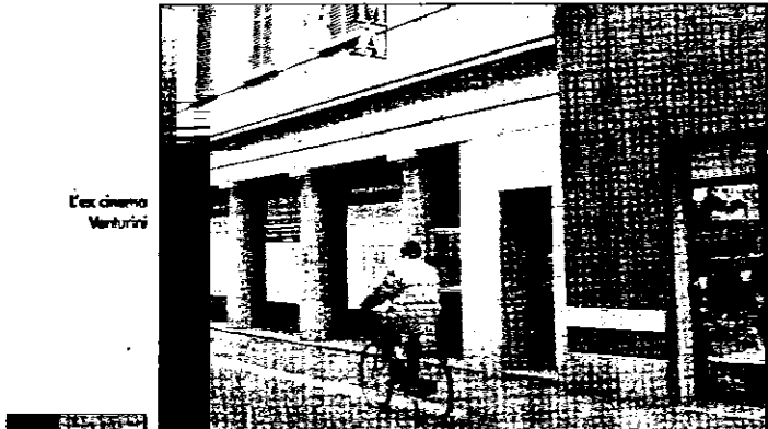
Ex cinema Venturini