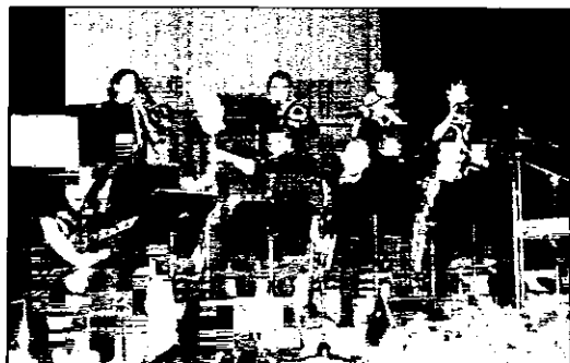
La Dams Jazz Orchestra protagonista del concerto al Sociale

Tradizione e novità per la festa della donna. Alla distribuzione della mimosa, con banchetti in tutte le piazze, si aggiungono decine di altre iniziative. A Ravenna il Ridotto dell'Alighieri ospita dalle 9.30 la seduta straordinaria del consiglio comunale che vedrà anche la consegna di attestati alle partigiane ravennate. Alle 11 il sindaco incontrerà poi in municipio donne immigrate. Intanto il Comune ha anche deciso di caratterizzare ogni iniziativa dell'8 marzo, a partire da oggi, con l'adozione a distanza di una bambina. Il Gruppo Udi sarà in piazza XX settembre e, dalle 15.30, proporrà lettura di brani di donne della ex Jugoslavia, afgane, palestinesi, algerine ed europee. Restando in tema di lettura, la libreria Feltrinelli propone una maratona dalle 15 in avanti, con brani e poesie sulla pace. Linea Rosa, che avrà un banchetto in via Cavour, di fronte a San Domenico, dà anche appuntamento alle donne alle 18 alla Ca'