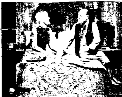
Una scena di "Camere da letto", in scena da stasera al Rossini