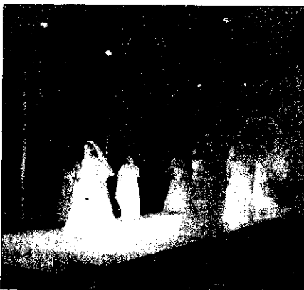
Tante le modelle che hanno sfilato nella passerella allestita al Teatro Rossini di Lugo