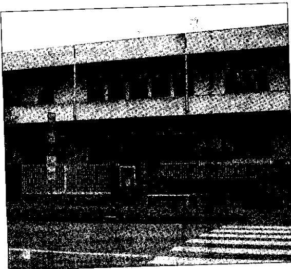
Il cinema Giardino

Certamente sui pesanti risultati degli ultimi mesi influisce anche la produzione cinematografica ed una crisi latente nel mondo dei film, con pellicole che non sempre risultano all'altezza delle aspettative e spettatori esigenti che si rifugiano nel noleggio delle videocassette dai