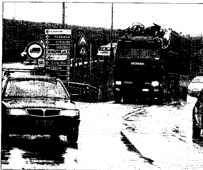
I mezzi pesanti, dopo la chiusura della 'S. Vitale' a S. Agata dovrebbero transitare per S. Bernardino. Ma per evitare giri troppo lunghi 'tagliano' per Cà di Lugo

A una settimana dalla chiusura del ponte di S. Agata, che ha comportato la deviazione del traffico dalla 'San Vitale' verso Cà di Lugo, la situazione appare critica per molti: per gli abitanti della frazione lughese, ora attraversata dal pesante carico di traffico diretto da Ravenna a Bologna e viceversa, per gli automobilisti disorientati nonostante i numerosi cartelli, e per i tecnici della Provincia, l'ente competente sia dei lavori sul ponte che dell'adeguamento della Fiumazzo, la strada che attraversa Cà di Lugo e che immette sul ponte individuato come alternativo a quello di S. Agata. Per tornare alla normalità ci vorranno almeno sei mesi, tempo previsto per il rifacimento del ponte sulla San Vitale. Non resta dunque che rimboccarsi le maniche e difatti ieri a Cà di Lugo c'erano rappresentanti della Provincia e i vigili urbani di Lugo con il comandante Elena Fiore. E c'erano lavori in corso: è stato infatti deciso di invertire le precedenze, in modo che il cospicuo flusso di traffico diretto verso Bologna e viceversa, quindi in salita e discesa dal ponte, non debba dare la precedenza al flusso ovviamente minore dei veicoli provenienti da San Lorenzo. I tecnici della Provincia ieri