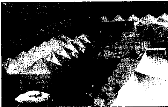
Si prevede una Fiera da record. Nella foto un momento della Fiera Biennale di qualche anno fa.

Il referente per i dieci Comuni coinvolti nell'operazione sottolinea poi l'intenzione ulteriore di potenziare la Fiera basandosi sulle grandi potenzia-