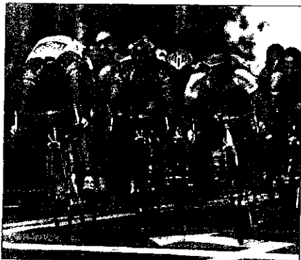
L'arrivo del Giro di Romagna a Lugo