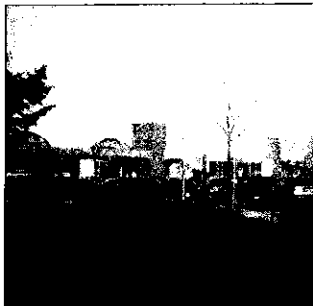
Tra i lavori non vi sarà l'ampliamento della superficie di vendita che rimane di 3.586 mq.