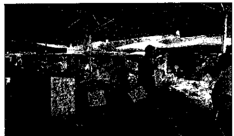
Per due mercoledì il mercato si sposterà.

suscitare alcune critiche, in particolare da parte della Confesercenti: «Pur consapevole dei problemi organizzativi che lo svolgimento della Fiera Biennale comporta - si legge in una nota - l'A.n.v.a. Confesercenti, ha comunque giudicato negativamente il coinvolgimento di ben cinque giornate di mercato, conside-