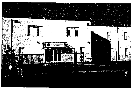
La nuova sede del Comando della Polizia municipale, che sarà inaugurata domani mattina

In questo modo l'amministrazione comunale completa un piano che prevedeva la dedica di strade o lapidi a tutte le medaglie d'oro al valor militare lughesi, dando risposta positiva alle sollecitazioni delle associazioni d'arma, del consiglio comunale e di diversi cittadini che, in questo caso, hanno conosciuto Gramigna, militare che guadagnò il riconoscimento durante la guerra in Etiopia nel 1936, quando rimase gravemente ferito per proteggere la ritirata dei suoi commilitoni e per riportare alla postazione militare più vicina l'auto-mezzo che aveva in conse-