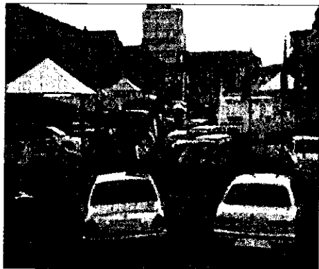
Un'immagine dell'ultima edizione della manifestazione "Expò 2002". La Fiera Biennale di Lugo cercherà di abbattere i record di espositori e di presenze fatti registrare nell'edizione 2000

LUGO - E' ormai scattato il conto alla rovescia per "Expò 2002". La Fiera Biennale di Lugo prevista nell'area interna ed in quella circostante il Pavaglione dal prossimo 14 settembre e sino a domenica 22. Gli organizzatori stanno preparando già da diversi mesi l'avvenimento ed ora, che mancano venti giorni all'inaugurazione, c'è grandissima attesa per l'importante rassegna.