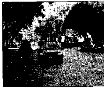
c.r. Viale Masi, teatro della sciagura

munque l'aveva? A Lugo c'è anche la postrada (e la finanza), sul territorio provinciale c'è pure la polizia provinciale. Il fatto è che non esiste coordinamento fra le forze dell'ordine presenti sul territorio: non c'è centrale comune, e lo sappiamo, ma accade troppo spesso che non ci siano neppure collegamenti fra le varie centrali. Così accade che ciò che potrebbe anche apparire come emergenza, viene trattato invece come un intervento ordinario.