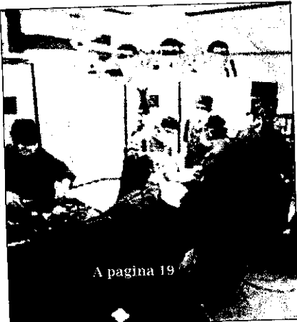
A pagina 19