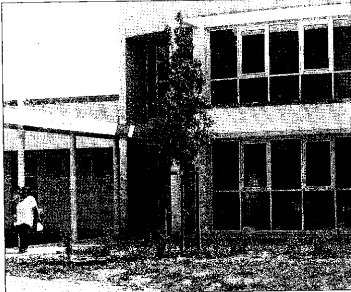
L'asilo di viale Europa è una struttura nuova che deve essere ancora tarata al meglio», sostiene il Comune che replica alle critiche dei genitori.

«È una scelta ben precisa quella di non installare l'impianto dell'aria condizionata in un asilo, allo scopo di evitare choc termici e possibili patologie respiratorie ai bambini. Per combattere il caldo sono allo studio altre misure a cominciare da un sistema di ventilazione nei locali dormitorio». Così l'amministrazione comunale lughese replica alle forti critiche sul caldo patito dai 45 bambini nell'asilo nido di viale Europa, un caso sollevato da diversi genitori che avevano sottolineato come spesso i piccoli fossero stati costretti a rimanere in mutande. Innanzitutto il Comune intende sottolineare come «non vi sia stata alcuna invasione del Comune per protesta da parte dei genitori dei bambini che frequentano l'asilo». Per quanto riguarda il caldo, «occorre fare alcune considerazioni, partendo dalla premessa che per l'edificio di viale Europa questa è la prima estate che funziona a pieno regime ed è quindi comprensibile che le modalità d'uso debbano essere tarate e migliorate». Tra l'altro, si rileva che «la struttura ha superato la stagione invernale senza problemi. Inoltre l'eccezionale caldo di questo giugno ha presentato problemi in tutti gli asili e scuole materne della Romagna, do-