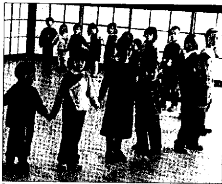
Bambini nella scuola del comprensorio di Lugo

data di caldo. Il parco che circonda l'edificio è stato piantumato con alberi ad alto fusto, con notevole investimento da parte dell'Amministrazione, ma naturalmente ha bisogno di tempo per sviluppare appieno i propri effetti sulla struttura. Nel frattempo sono stati inseriti ripari dal sole nell'area verde per ampliarne la fruibilità". La richiesta di aria condizionata stride inoltre con alcune norme sa-