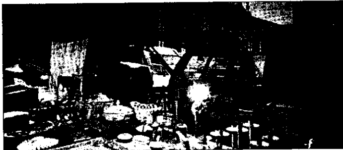
Il mercatino serale nella scorsa edizione di "Lugo venti d'estate"

Come ormai anticipato a più riprese si continuerà, dunque, a seguire il filone che la scorsa estate, con un'edizione pilota per sondare le potenzialità del progetto ed il gradimento dei cittadini, ha garantito un successo strepitoso, superiore ad ogni aspettativa. Negozi aperti di sera, ma anche uno spettacolo musicale centrale sul Monumento a Baracca e molte iniziative di animazione