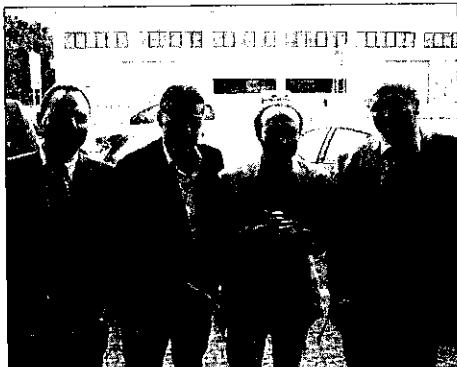
In alto il momento del taglio del nastro. A lato la nuova sede dell'Api

"In questo modo - continua Bagnari - saremo certamente in grado di offrire maggiori servizi e garanzie agli imprenditori locali. Ecco perché la sede di Lugo rap-