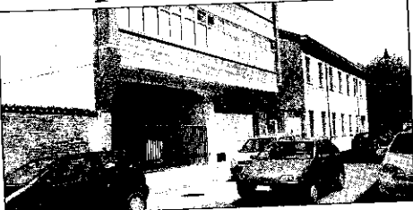
Il nuovo commissariato di Polizia in via Emaldi

Come era facilmente prevedibile, la nuova sede del commissariato di Polizia a Lugo non entrerà in funzione domani, lunedì 24 giugno. Problemi di ordine tecnico, dall'allacciamento delle linee elettriche e delle utenze alla consegna dei mobili, stanno ritardando il trasferimento dagli uffici di via Risorgimento ai nuovi di via Emaldi, sede in cui, tra l'altro, manca anche l'impianto di climatizzazione e con il gran caldo di questi giorni lavorare in quegli uffici sarebbe veramente un problema. Il trasferimento quindi slitterà alle prossime settimane e, come confermano dalla Questura di Ravenna, «attual-