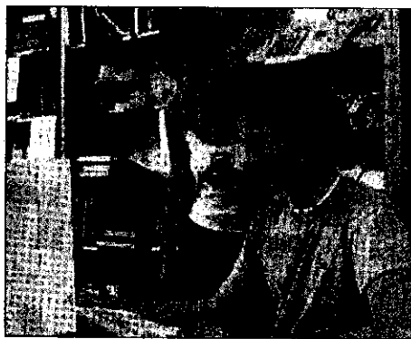
Computer e comunicazioni: un binomio ormai inscindibile

La prima di queste è rappresentata dall'apertura dell'Urp, Ufficio per le Relazioni con il Pubblico, attivo in Largo Relencini al piano terra della Rocca già da diversi mesi, ma negli ultimi tempi altre due idee hanno attirato l'attenzione sui metodi adottati per comunicare con i cittadini in maniera efficace. Rimarrà infatti aperto fino al 14 luglio, nella galleria della Banca di Romagna, un Punto di Ascolto che darà la possibilità a tutti i cittadini di visionare il cd rom sul progetto "Lugo Sud", il quale prevede una serie di opere pubbliche pensate per migliorare la viabilità attorno a Lugo, trovare una soluzione per i collegamenti ostacolati dalla barriera ferroviaria ed integrare i vari interventi previsti con gli sviluppi urbanistici conseguenti alla realizzazione del